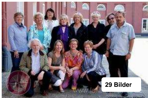
Die Künstlerinnen und Künstler der Ausstellung "Abschied"